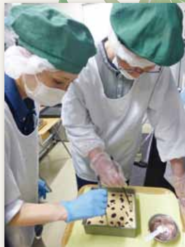
New York Style Rose Cheese Cake!!

1本540円ですが、お店へ買いに来て下されば420円になります。 ぜひぜひ、ガーデンテラスへお立ち寄り下さいね!! 販売はガーデンテラス・道の駅(ふちゅう)でしています。 カフェでも召し上がれます。ランチのデザートにいかがですか~ ランチお弁当の注文は090-4744-0141(ガーデンテラス)