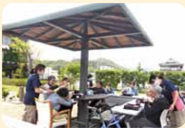
桜を見ながら庭でお弁当を食べました。