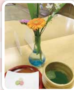
抹茶を点てました