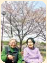
桜を見に行きました。