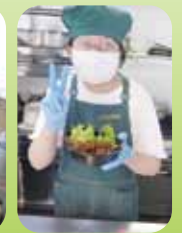
上手に盛り付けたよ(*艸*)