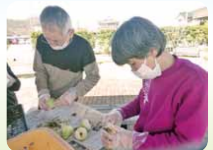
心を込めて…綺麗にね!