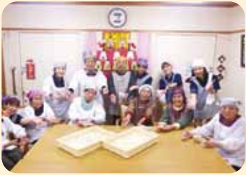
お餅つきをしました。