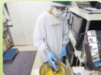
ケーキ作りに挑戦〜 楽しい☆