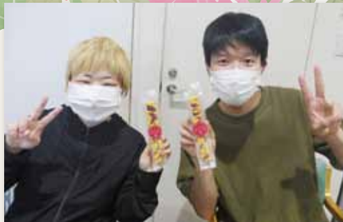
サンプルも自分達で作ったよ~♪